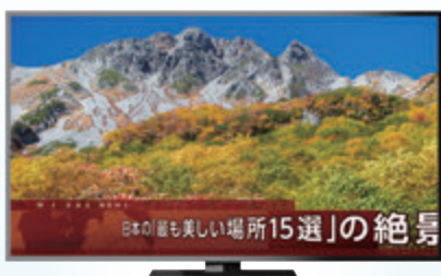
テロップシステム