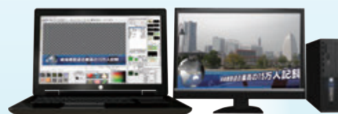
ネットワーク対応 ノンリニア編集連携テロップシステム