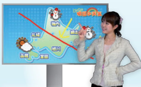
タッチモニタシステム