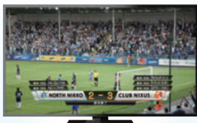
スポーツオンエアシステム