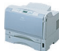
帳票等出力プリンタ